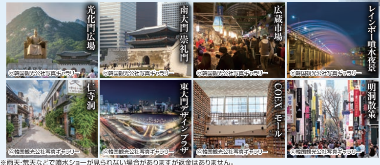
*雨天・荒天などで噴水ショーが見られない場合がありますが返金はありません。