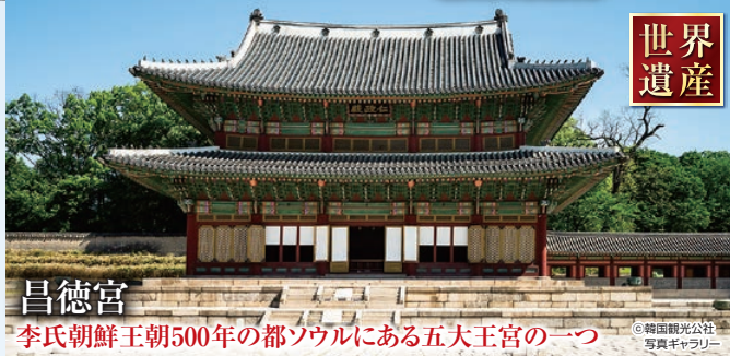
昌徳宮 李氏朝鮮王朝500年の都ソウルにある五大王宮の一つ