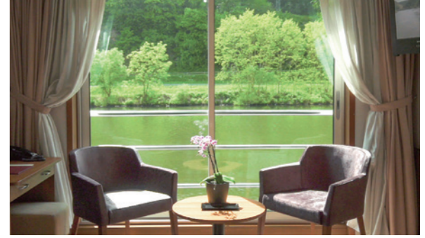
天井から足元までである開放的な窓(1階客室は小型窓で、開閉できません)