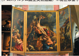
ルーベンス「キリストの昇架」 (アントワープ・大聖堂蔵)