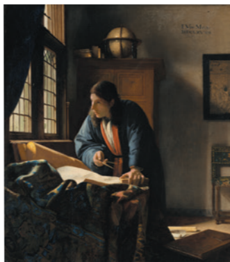
シュテューデル美術館 フェルメール「地理学者」のほか ポッティチェリの作品も収蔵