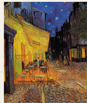
ゴッホ「夜のカフェテラス」 (クレラー・ミュラー美術館蔵)