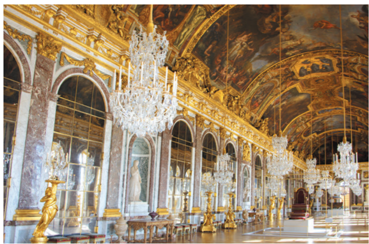
パリ郊外のベルサイユ宮殿の観光にもご案内します。

パリのご滞在は5つ星ホテル ★★★★★ アール・デコとモダンなスタイルの融合 オテル・デュ・コレクシヨヌールに3連泊