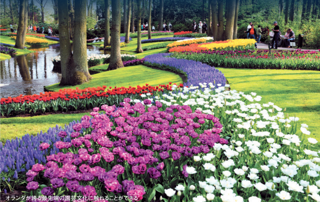
オランダが誇る最先端の園芸文化に触れることができる