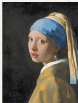
フェルメール「真珠の耳飾りの少女」 (マウリッツハイス美術館蔵)