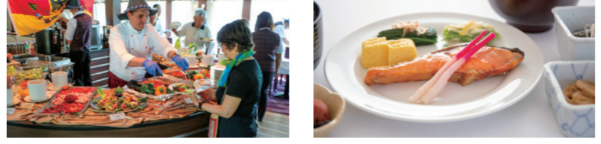
ライン河の船旅では、ドイツ料理も楽しめる 時には和朝食もご用意