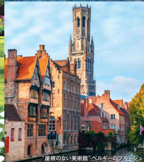
「屋根のない美術館」ベルギーのブルージュ