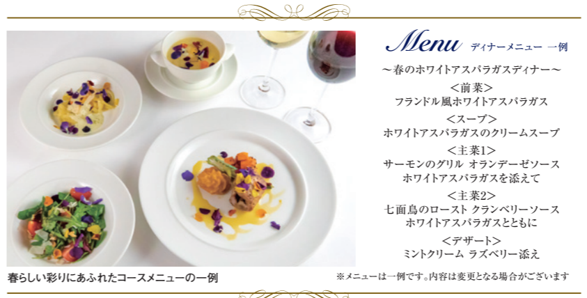
春らしい彩りにあふれたコースメニューの一例 ※メニューは一例です。内容に変更となる場合がございます

専属シェフが心を込めてつくります! 寄港地の郷土料理も楽しめる、多彩なお食事 就航以来、多くのお客さまのご意見を取り入れ、工夫を重ねてきたお食事。素材にこだわり、1品の量は控え目に。フルコース料理も最後までお楽しみいただけるよう配慮しました。