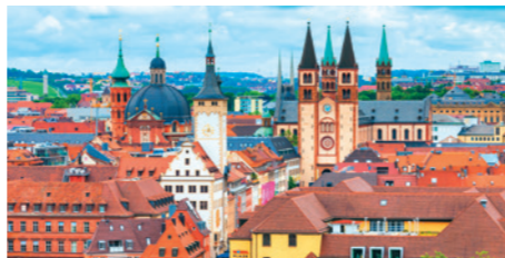
ロマンチック街道の街ヴュルツブルクの街並み(対岸より)