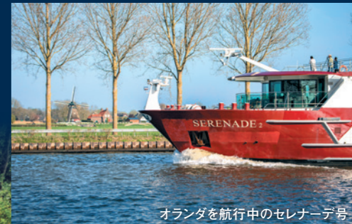
オランダを航行中のセレナーデ号

昨年秋も大好評だったセレナーデ号で迎える春のヨーロッパ 人気の2コースを特別に高松空港/徳島空港発着でご案内します。 歴史も文化も河に沿って発展してきたヨーロッパ、 花咲く春の壮大な風景と世界遺産、美術館めぐりをお楽しみください。