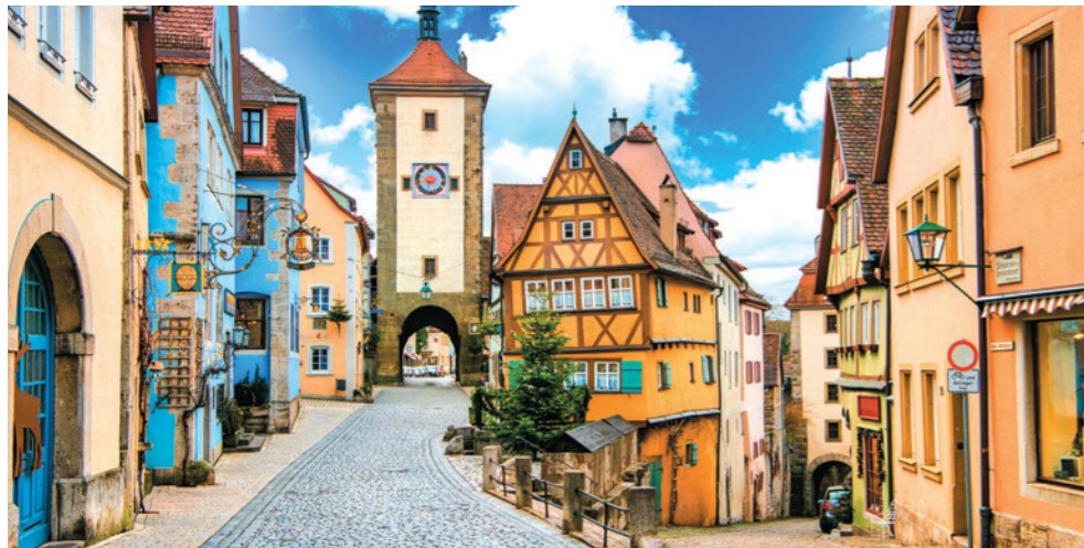
中世の街の文化を感じるローテンブルクを終日観光