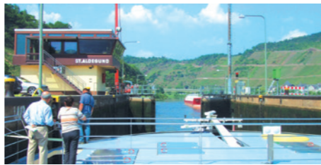
水門を通過するセレナーデ号