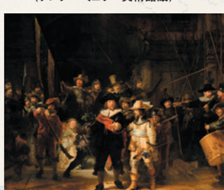
レンブラント「夜警」 (アムステルダム国立美術館蔵) ※現在修復中